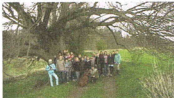
Gruppenfoto unter der Buche