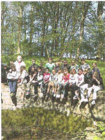
An der Quelle